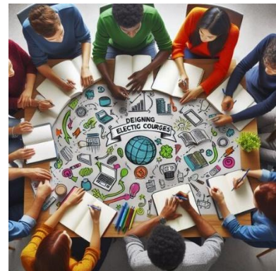
Illustrasjon: Generert med KI

I tillegg til å lære om designprinsipper og estetikk, vektlegger faget også viktigheten av bærekraftig design og ressursutnyttelse. Ved å utforske begrepet "redesign" oppfordres elevene til å tenke kreativt rundt gjenbruk, resirkulering og oppgradering av eksisterende produkter for å minimere avfall og miljøpåvirkning. Gjennom "Design og Redesign" får elevene ikke bare muligheten til å utvikle sine designferdigheter, men også til å utforske hvordan design kan være en kraft for positiv endring i verden.