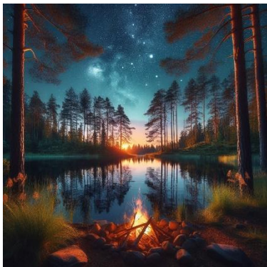
Illustrasjon: Generert med KI

Friluftsliv er et sentralt fag for å bidra til naturglede og respekt for naturen. Faget skal gi elevene forståelse av mangfoldet i naturen og legge til rette for praktiske utfordringer som er tilpasset elevenes nivå slik at alle opplever mestring. I faget skal elevene utvikle kompetanse til å ta ansvarlige og miljøbevisste valg som bidrar til en bærekraftig utvikling. Faget skal styrke elevenes evne til å ta vare på seg selv og andre i naturen.